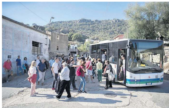
Il servizio dell'Atp lo scorso anno

Per quanto riguarda l'azienda trasporti pubblici Atp, oggi e domani, dalle 8 alle 21 saranno in servizio continuato 5 autobus navetta gratuiti nell'area stradale compresa tra la Strada