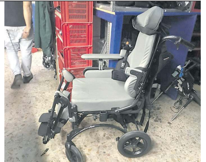
Un'altra carrozzina finita rapidamente fuori uso